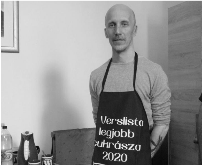
A Verslista legjobb cukrásza 2020-ban

Miattad jobb ember lettem Bár ezt nem mondtam el Még itt vagy benn a szívemben Sose engedlek el