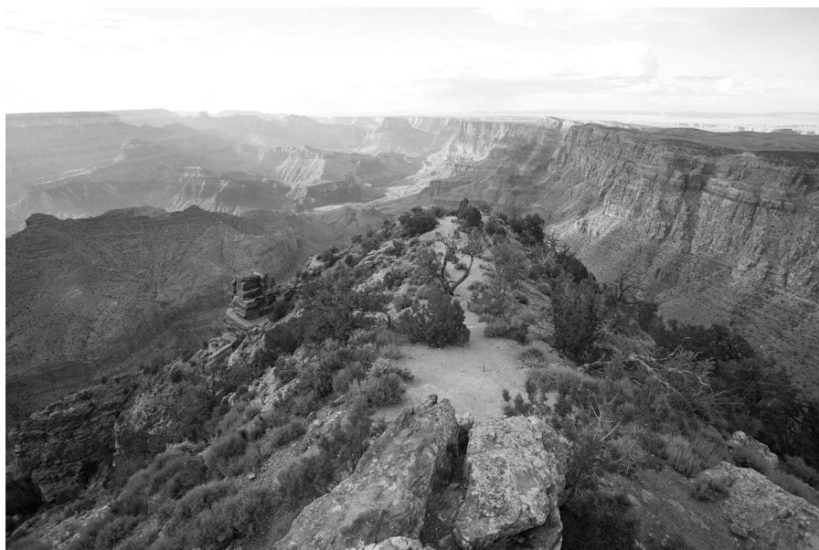
Pók András: Grand Canyon

Senki nem hiszi, és nem tudja, hogy egyszer jövő lesz a múltja, pedig minden ember egy legenda.