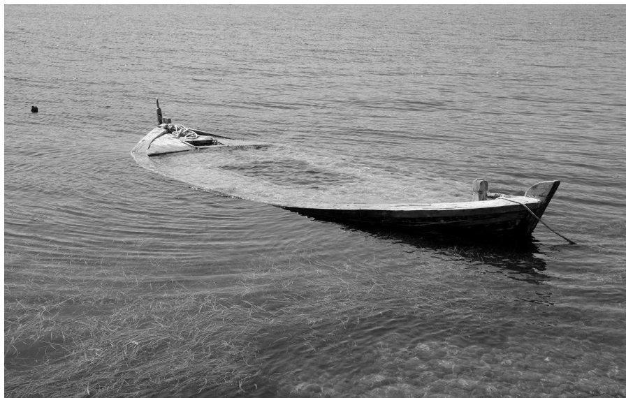
Pók András: Elsüllyedve