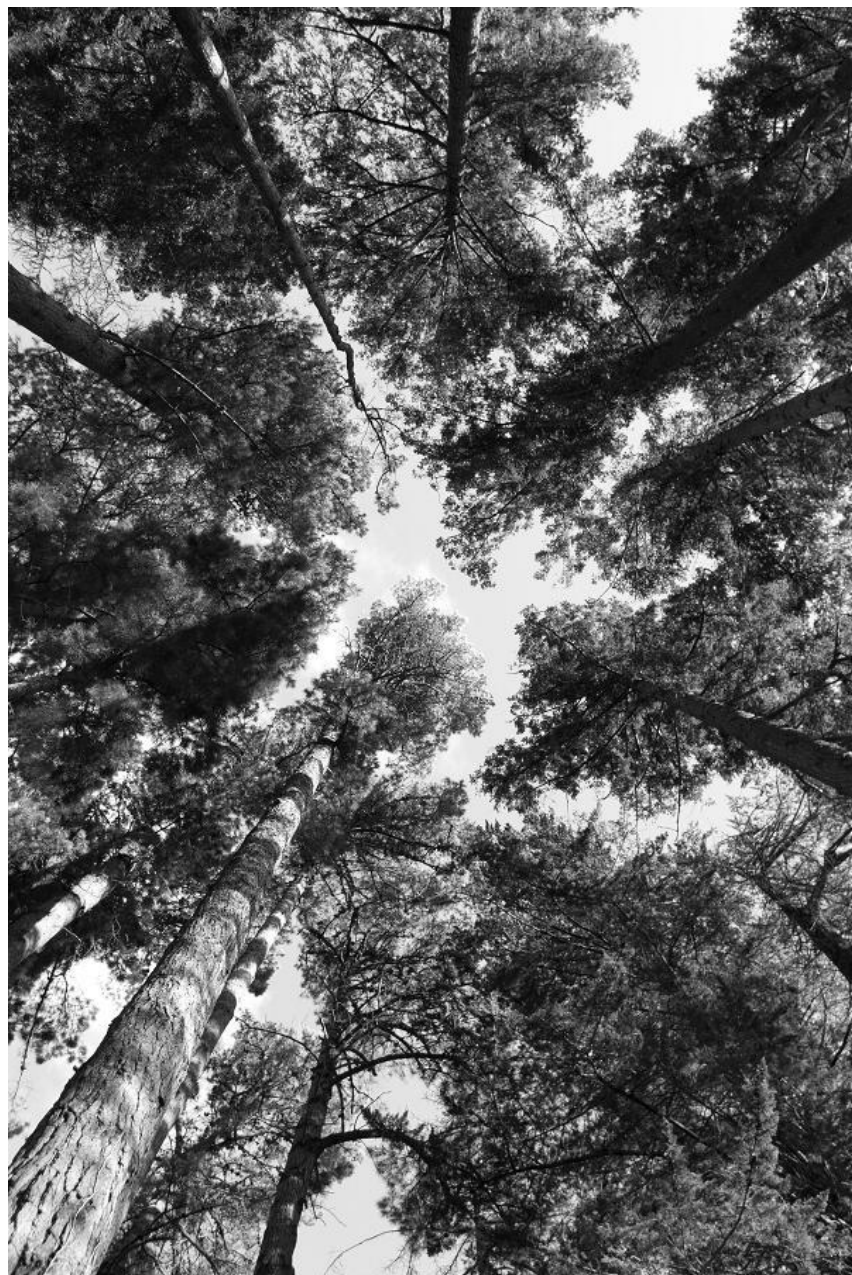
Pók András: Égig ér