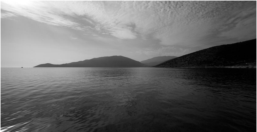
Pók András: Távolban

te nem éltél értem hát én nem tehetem a döntésed legyen az enyém is ezt az esélyt adtad nekem