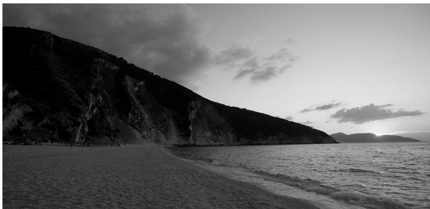
Pók András: Naplemente

Az életet élni kell ahhoz, hogy mindig történjen valami, és mindenki a saját életét mozgatja, irányítja. Ha nem így tesszük, akkor elmegy mellettünk, értelmetlenül.