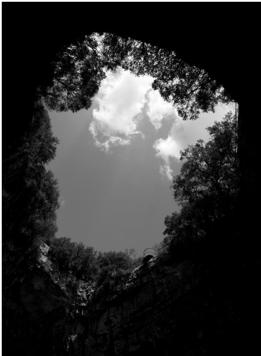
Pók András: Barlang