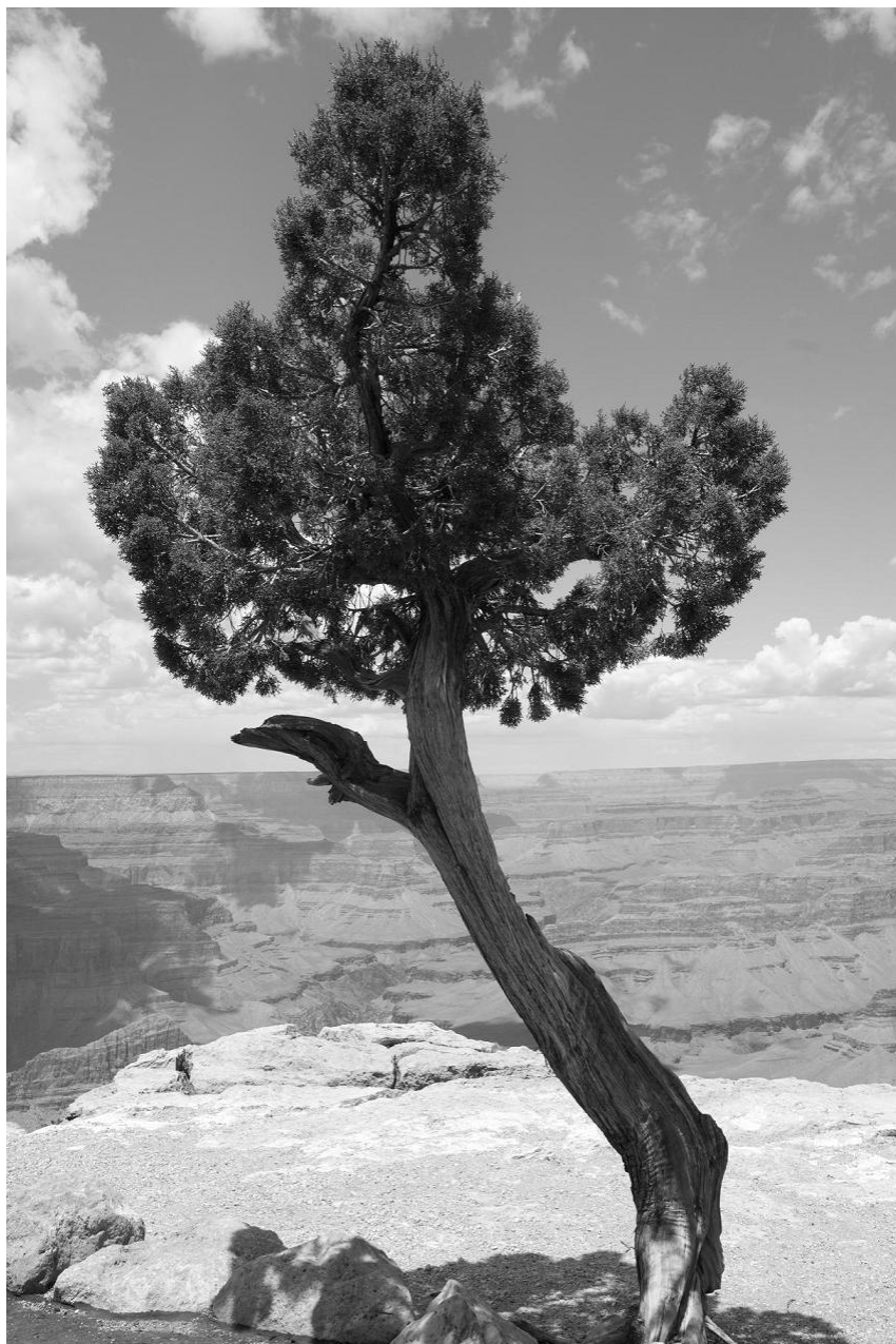
Pók András: Egyedül