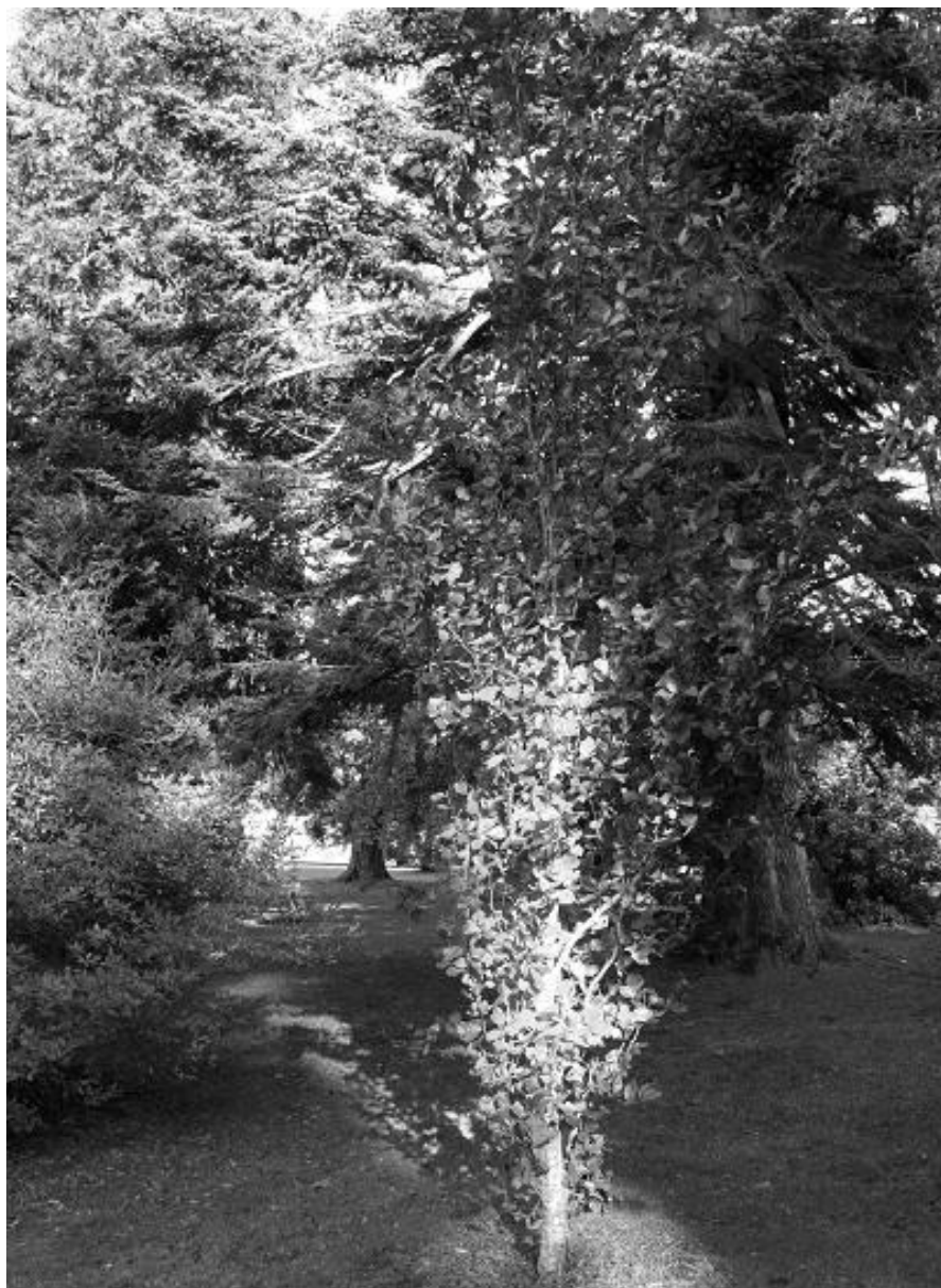
Pók András: Fényben